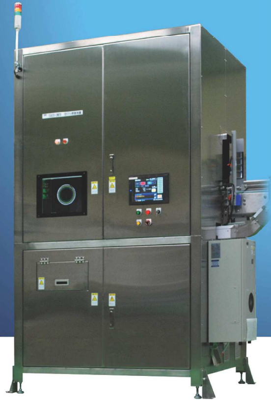
■ びん口検査画像 (欠け)

充填前の空びんを複数のカメラで 撮像し、不良品を検出します。 ストレート搬送を採用し、 インラインで高速・高精度に 自動検査を行います。